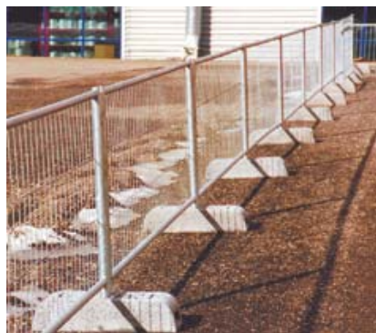
1,1 m magas elemek földcövekkel