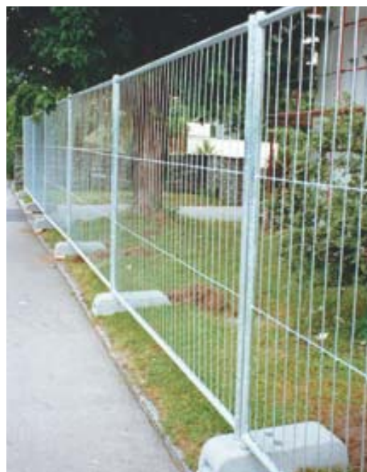
2 m magas elemek