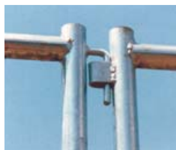
Felső össze- kötés az elemeknél